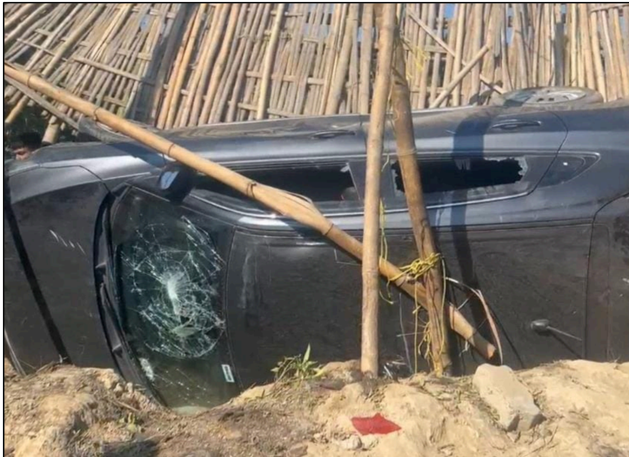
পলায়নৰ চেষ্টা চলাওতে হাজোত এনেদৰে বাগৰি পৰিল ছাগলী চোৰৰ বাহন, ফটোঃ ই-সংবাদ, হাজো

হীৰাপাৰা-মিলপাৰা পথৰে পলায়নৰ চেষ্টা কৰে। কিন্তু উক্ত পথছোৱাত আছিল এখন বাঁহৰ সাঁকো। বাঁহৰ সাঁকোৰ ওপৰৰে বিলাসী বাহনখন পাৰ হ'ব খোজোতেই সাঁকো ভাঙি তলত পৰে ছাগলী চুৰি কৰা বাহনখন। লগে লগে অঞ্চল জুৰি ছাৰা-দুৱাৰ সৃষ্টি হয়। ঘটনাস্থলীত স্থানীয় ৰাইজ উপস্থিত হোৱাত ছেগ বুজি পলায়ন কৰে গাড়ীখনৰ ভিতৰত থকা চাৰিজনকৈ ছাগলী চোৰে। অৱশেষত স্থানীয় আৰক্ষী উপস্থিত হৈ গাড়ীখন পাৰলৈ তোলাৰ ব্যৱস্থা কৰে। লগতে গাড়ীখনৰ ভিতৰৰ পৰা উদ্ধাৰ কৰে দুটাকৈ চুৰি ছাগলী। আৰক্ষীয়ে ছাগলীসহ গাড়ীখন জব্দ কৰি ৰামদিয়া আৰক্ষী থানালৈ নিয়ে।